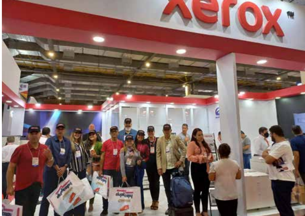
Evento em conjunto com a Xerox do Brasil