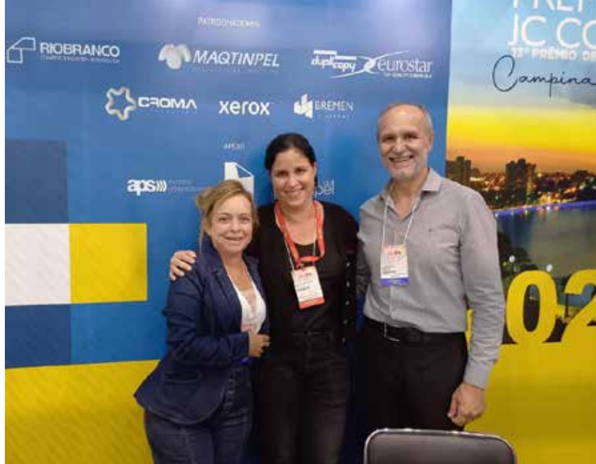
Falando sobre digital

ideal com as cores escuras impressas, valorizando os meios-tons e dando vivacidade às cores mais claras. Destaca-se nesse tópico a tolerância extremamente reduzida admitida na alvura do produto, no processo de controle de qualidade, que é de uma variação máxima de 0,35%, enquanto os papéis comuns admitem, no geral, até 3,5%.