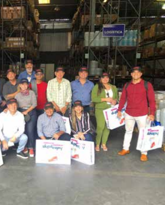
Visita à fábrica e distribuição de kits para impressoras digitais